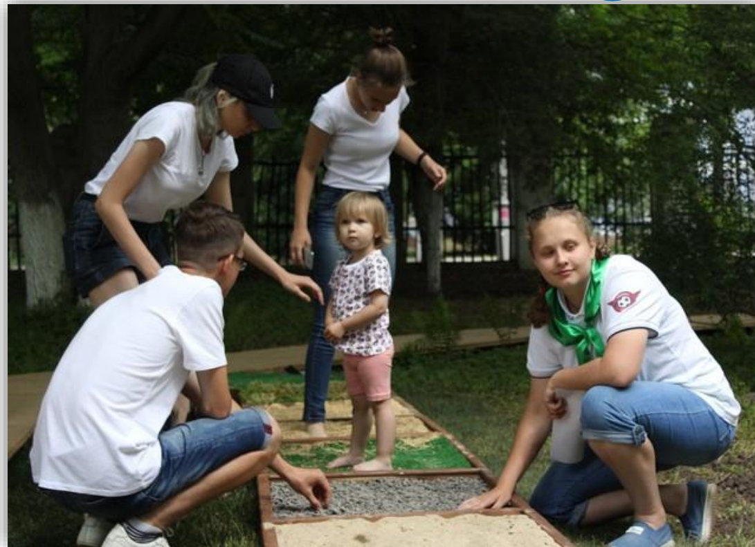
Тропа для ног