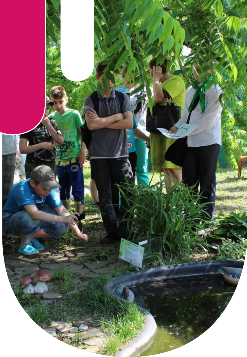
«Вода в ландшафте»